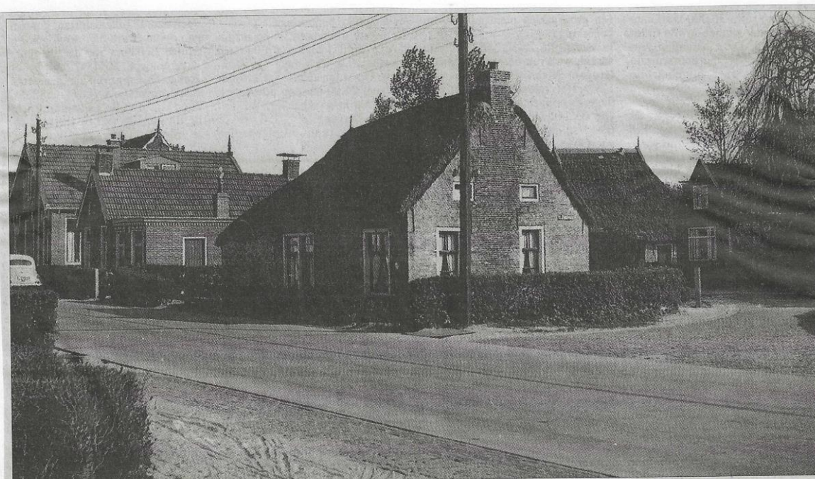
Woning in het centrum van Drogeham met huisnummer 40 in mei 1954, afgebroken in 1960, het laatst bewoond door S.J. van der Meer.