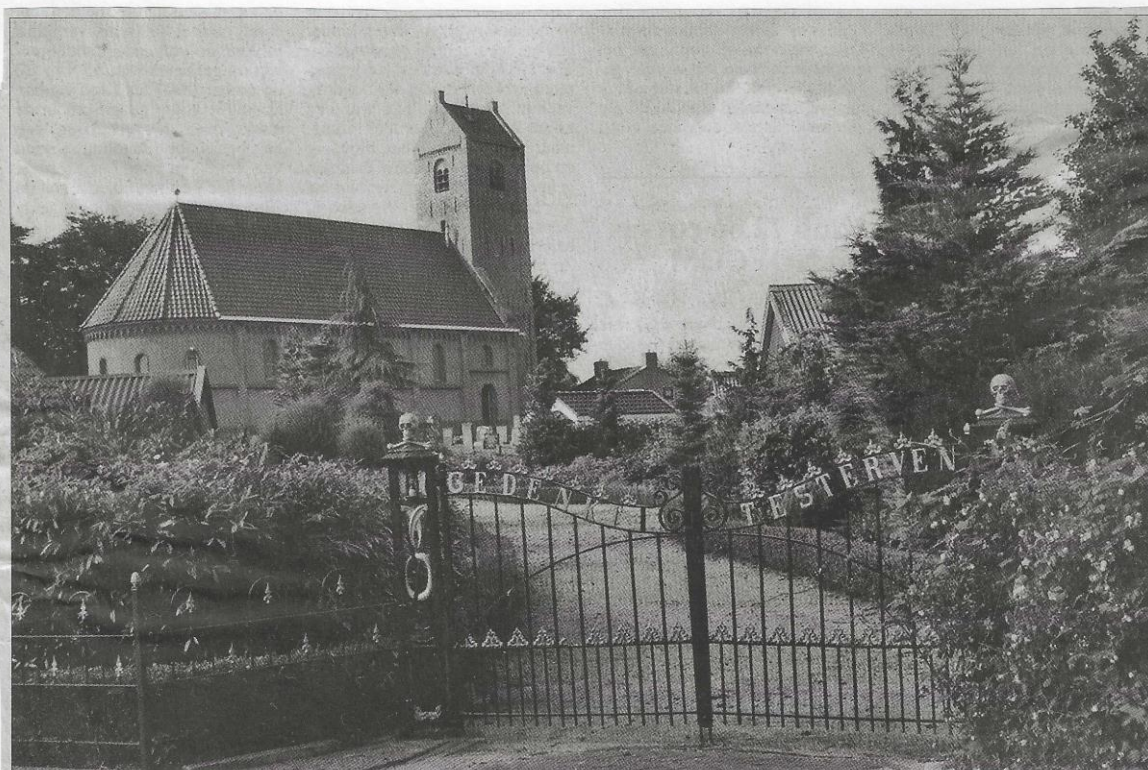
Recente opname van de Nederlands hervormde kerk te Drogeham.